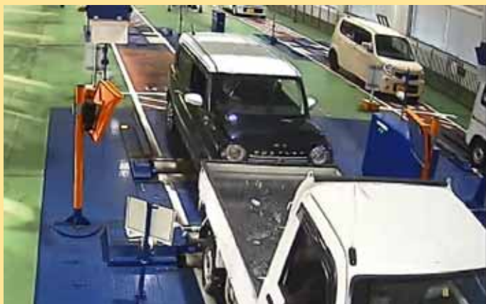
サイドスリップ検査時にペダルを踏み間違い、前方車両に追突。