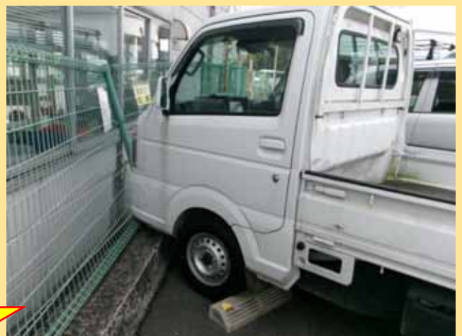
駐車場で、駐車しようとする際にペダルを踏み間違い、フェンスに衝突。