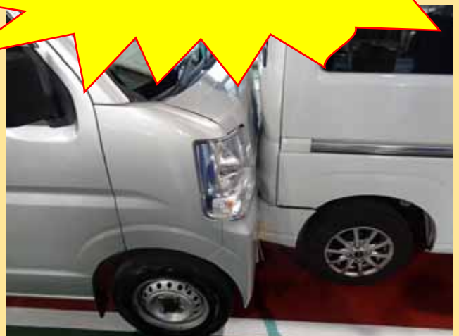
検査コース入り口からテスト進入時にペダルを踏み間違い、前方車両に追突。