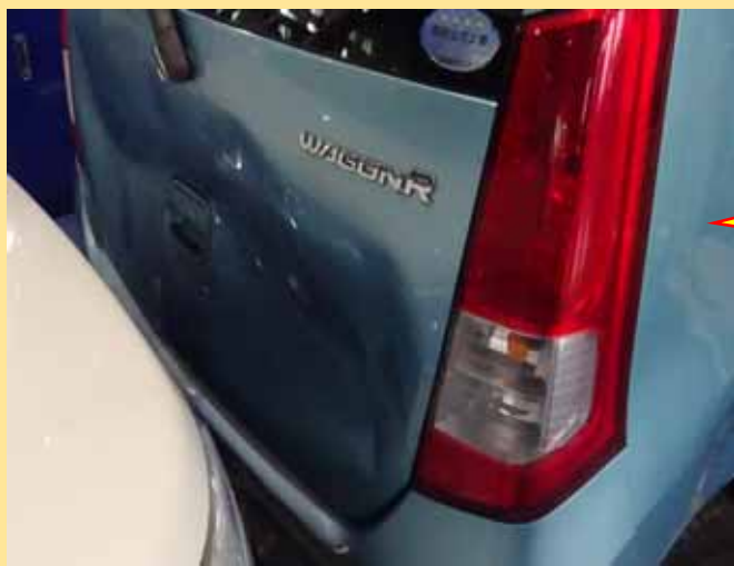
サイドスリップテスト終了後、停止しようとした時にペダルを踏み間違い、前方車両に追突。